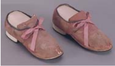
(Photo 8) Sandales liturgiques, collection Musée de la civilisation, exemple de formes pour des chaussures, Centre de conservation du Québec,

http://www.ccq.mcc.gouv.qc.ca/realisations/textiles/sandales_liturgiques.htm