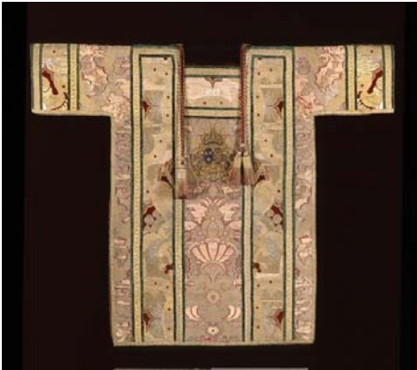
(Photo 7) Dalmatique, collection Musée de la civilisation, photographie Michel Élie, Centre de conservation du Québec, T-2000-19.

Pour les expositions de courte durée, on peut aussi utiliser des tubes d'ABS ou de polyéthylène (B0482, p.25, 29, 33). On crée alors des formes adaptées aux vêtements en assemblant les pièces avec de la colle chaude . Puisqu'elles contiennent du PVC, on les recouvre de jersey de coton pour éviter qu'elles touchent les vêtements.