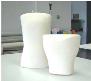
(Photos 2-3) Disques en mousse Ethafom® empilés et bustes recouverts de jersey de coton, atelier des textiles, Centre de conservation du Québec.