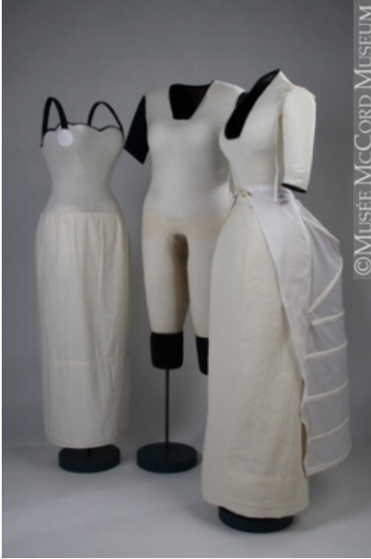
(Photo 4) Mannequins constitués d'une forme évidée et de formes pleines, fabriqués par Caroline Bourgeois, Musée McCord. http://www.mccord-museum.qc.ca